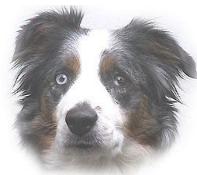
El Merino's Hot Stuff

Olika omständigheter gjorde att hon kom tillbaka till mig och senare fick flytta till Lappland på prov inom renskötsel. Jag visste inte riktigt vad detta jobba innebar men hon skulle definitivt inte låta sig knäckas iallafall, det var inget att tvivla på. Hon fick bestämda regler att hålla sig till vilket troligen gjorde att hon lugnade ner sig och hon började få