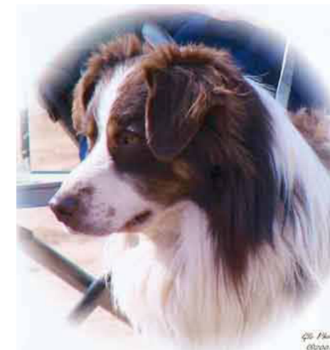
Crown Point Cowpuncher