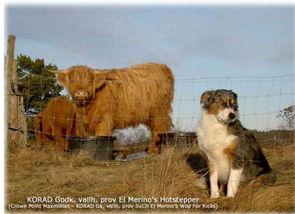
KORAD Godk. vallh. prov El Merino's Hotstepper (Crown Point Maxmillian - KORAD Gk. vallh. prov SuCh El Merino's Wild För Kicks)