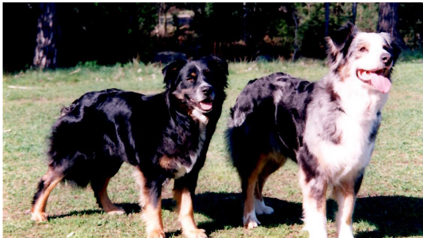
Tarcott Amber Nectar "Debbie" tillsammans med El Merino's Little Witch "Ylle"

Allt detta gjorde mig extremt nervös och jag var väldigt orolig över vad som skulle hända när det var min hunds tur att släppas lös. På darriga ben klev jag in i hagen, där instruktören höll flocken med sin Border collie. På instruktörens order kopplade jag loss min hund och i ungefär samma ögonblick