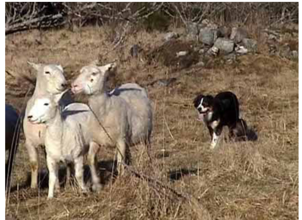
El Merino's Busy

Hösten 1997 ordnade jag en vallningshelg på får, speciellt för