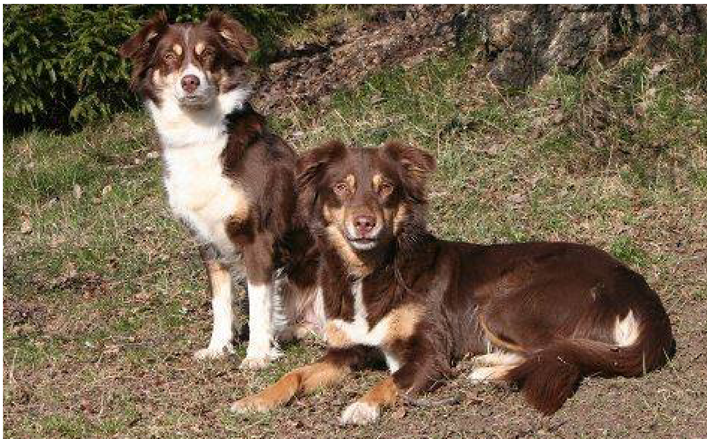
El Merino's Real Stuff med sin dotter El Merino's New Wave